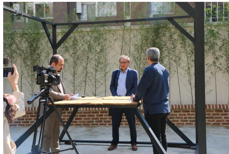
توضیحات تصویر: مصاحبه اختصاصی با پروفیسور کامران وفا