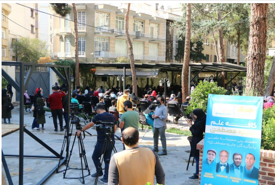
توضیحات تصویر: حضور خبرنگاران ، دانشجویها و اساتید فیزیک در نشست ترویج علم