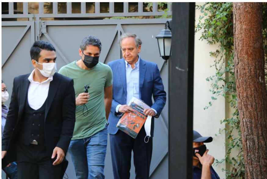
حضور پروفیسور کامران وفا در نشست ترویج علم در شهرکتاب مینا